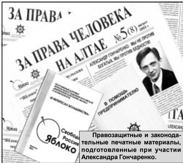
Правозащитные и законодательные печатные материалы, подготовленные при участии Александра Гончаренко.

Но именно в это время, на пике творческой зрелости, по злему стечению обстоятельств он попадает под жернова чиновничьего произвола. В таких случаях бывает два исхода: либо человек ломается, уходит “на дно”, микрирует, либо встает на путь правозащитной деятельности. Александр Ильич Гончаренко, в полной мере испытав на себе давление бюрократического аппарата — отвратительного скопища глупцов и карьеристов, — решает на важный шаг: он идет в политику, чтобы бороться с произволом чиновников, защищать интересы рядовых граждан. К тому времени жизнь внесла коррективы в его мировоззрение. Умом и сердцем поддержавший демократические реформы в России, он стал понимать, что с лидерами этих преобразований ему не по пути. Их “реформы” сопровождали нищета, безработица, разгул преступности и наркомании. Однажды в 1996 году на рынке он стал свидетелем горячего спора. Два рэкетира накануне решающего голосования президентских выборов громко выражали свою поддержку Борису Ельцину. В тот раз Александр Ильич, в 1991 году голосовавший за Ельцина, впервые ужаснулся тому факту, что невольно оказался в одной компании с преступным элементом. Ужаснулся и задумался. И отдал свой голос Григорию Явлинскому. В 1998 году Александр Гончаренко вступил в партию “Яблоко”, а с января 2002 г. возглавил ее региональное отделение. В 2004 г. перед выборами краевого Совета был создан блок “ЯБЛОКО+СПС”, а Александр Гончаренко стал его сопредседателем.