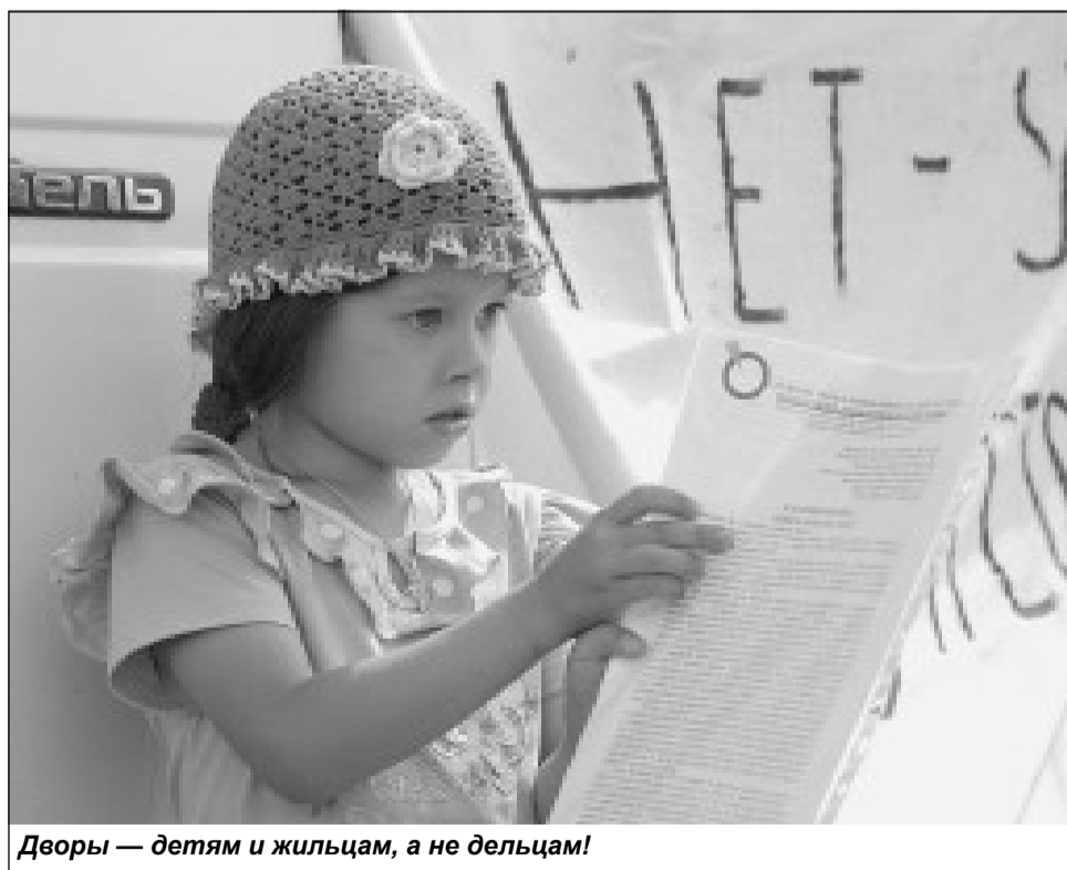
Дворы — детям и жильцам, а не дельцам!

застройке. Уполномоченными органами власти не до конца просчитываются отрицательные санитарно-эпидемиологические, экологические, материальные последствия от строительства новых объектов для граждан, проживающих в них. Зарегистрированы факты строительства на территории бывших кладбищ. Обращения в органы власти и краевую прокуратуру не дают справедливого результата, суды затягиваются, а в это время полным ходом идут подготовительные, а иногда и уже